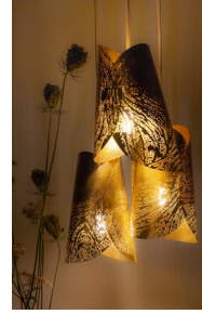
Sylvie Capellino, 1P2L

La ville de Nontron a été de tout temps à la fois rurale et industrielle. Ses filatures, ses tanneries, sa tradition coutelière ont fait, au fil des époques, la réputation de la ville. On compte aujourd'hui encore des entreprises prestigieuses comme Hermès (produits de luxe : maroquinerie, cravates, arts de la table), CWD (sellerie qui équipe de grands champions), 2 coutelleries fabricant « le Nontron » et « le Périgord », mais aussi des professionnels métiers d'art indépendants avec une présence importante à l'échelle du Périgord Vert.