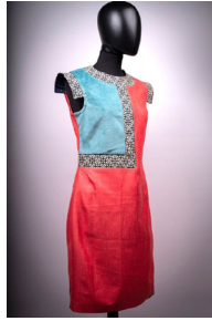
Fozia Hafiz, CHUUUTES