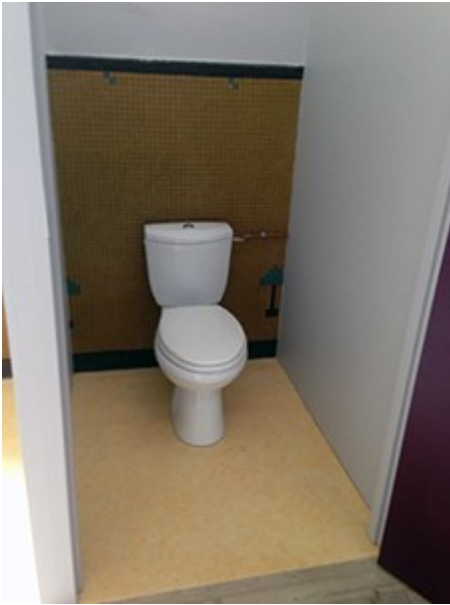
Gambetta : mise en place d'un WC à l'étage

Ecole Anatole France : afin de moderniser l'enseignement, chaque classe dispose dorénavant d'un vidéoprojecteur – la réfection d'une salle de cours a eu lieu pendant l'été et les menuiseries ont été changées durant les vacances d'automne.