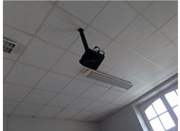
Anatole France : Vidéo projecteur

Tous ces travaux réalisés par la municipalité représentent un montant de 20 558 euros.