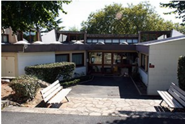
L'entrée de l'école Jean Rostand