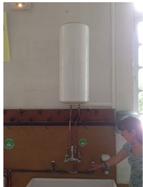
Gambetta : le chauffe eau

Ecole Gambetta : au printemps il a été posé un récupérateur d'eau qui permet d'alimenter le potager créé par les enfants – il a été également installé un sanitaire à l'étage, ce qui facilite le quotidien des enfants.