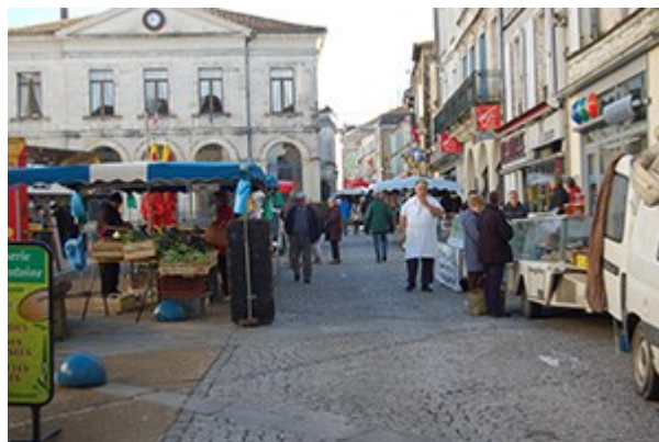
Le marché du samedi matin

En collaboration avec les commerçants, nous travaillons à l'organisation d'un grand marché de Noël le 23 décembre 2014 de 10h à 18h durant lequel des animations seront proposées aux enfants.