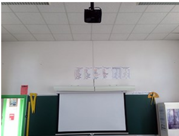
Anatole France : La mise en place des vidéo projecteurs