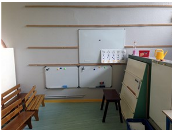
Jean Rostand : Installation de tableaux « Veleda »

Ecole Gambetta : au printemps il a été posé un récupérateur d'eau qui permet d'alimenter le potager créé par les enfants – il a été également installé un sanitaire à l'étage, ce qui facilite le quotidien des enfants.