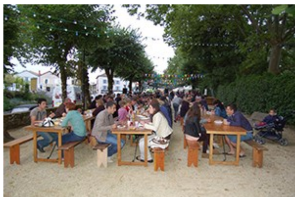
Le marché des producteurs

Cet été, nous avons organisé les marchés de producteurs aux allées de Bussac. Lors de la réunion de bilan, les producteurs et les associations chargées des animations nous ont fait part de leur satisfaction et souhaitent renouveler l'opération l'année prochaine. La mise en place d'un stand de tri sélectif des déchets et de gobelets réutilisables sur ces marchés ayant rencontré un bel enthousiasme, nous envisageons donc l'achat de gobelets réutilisables à l'effigie de « Nontron ». Ils seront à disposition de toutes personnes souhaitant organiser une manifestation. Le but est bien sûr de limiter les déchets plastiques à usage unique.