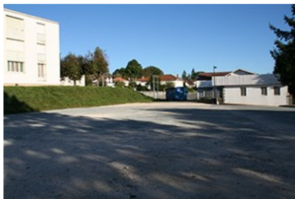
La place devant les HLM

Suite à la démolition de la barre HLM du champ de foire 10 logements individuels vont être construits sur l'espace laissé libre par Horizon Habitat. La commune s'est engagée de son coté à réaménager dans sa totalité la place qui se trouve devant les HLM restants.