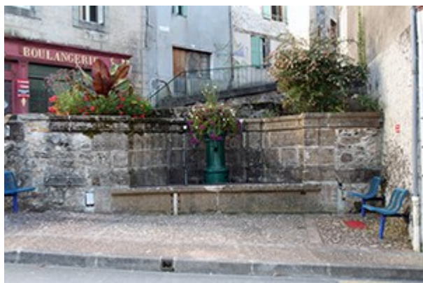
Fontaine du Canton

Un projet est à l'étude pour la rénovation et remise en route quand c'est possible des fontaines de la ville.