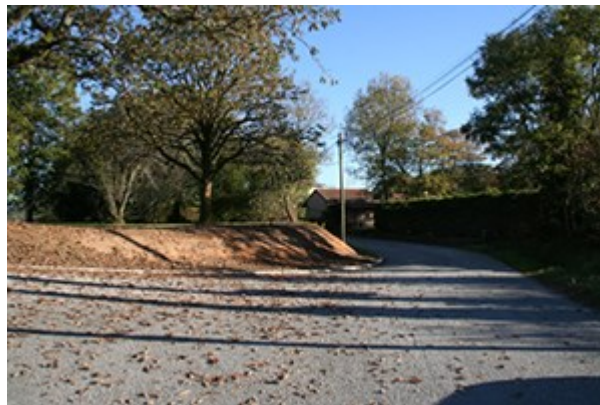
Après les travaux : Le chemin de Bellevue

Un « argilier » a aussi été traité en régie par les services techniques afin d'éviter un affaissement de la chaussée. Il faut savoir que toutes ces routes étaient prévues au départ pour la circulation des charrettes et pas pour des camions de 40 tonnes.