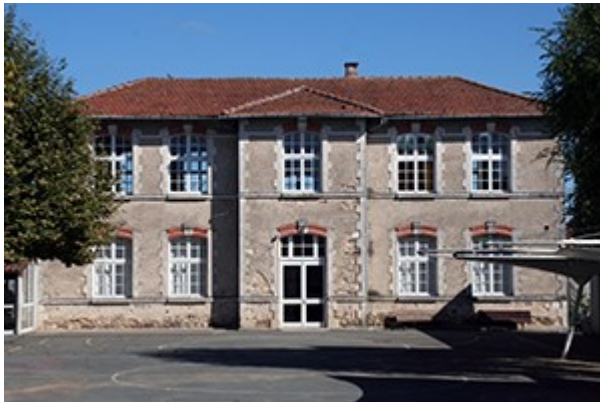
L'école Anatole France

Ecole Anatole France : afin de moderniser l'enseignement, chaque classe dispose dorénavant d'un vidéoprojecteur – la réfection d'une salle de cours a eu lieu pendant l'été et les menuiseries ont été changées durant les vacances d'automne.