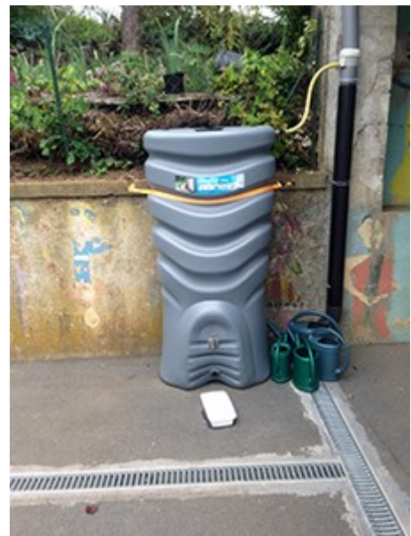
Gambetta : le récupérateur d'eau