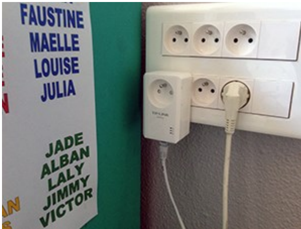
Jean Rostand : Mise en place de prise de courant porteur en ligne pour permettre l'accès internet dans toutes les classes.