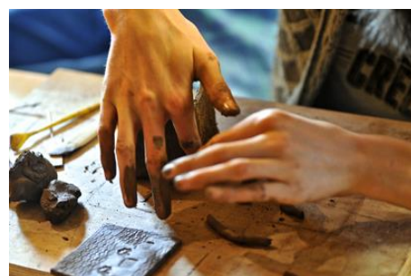
Vues de l'exposition « A table et autour » ©PEMA ; « Intérieur-Extérieur-Passage » design Samuel Accoceberry avec Benoît Obé, ébéniste ©Bernard Dupuy ; vue d'atelier © Jean-Yves Le Dorlot – Pnr-PL.