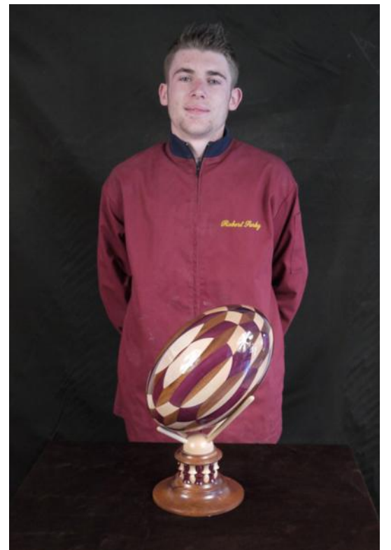
Illustrations : Alexander hay + Marin Thuéry ; CAP Art du bois de Thiviers.