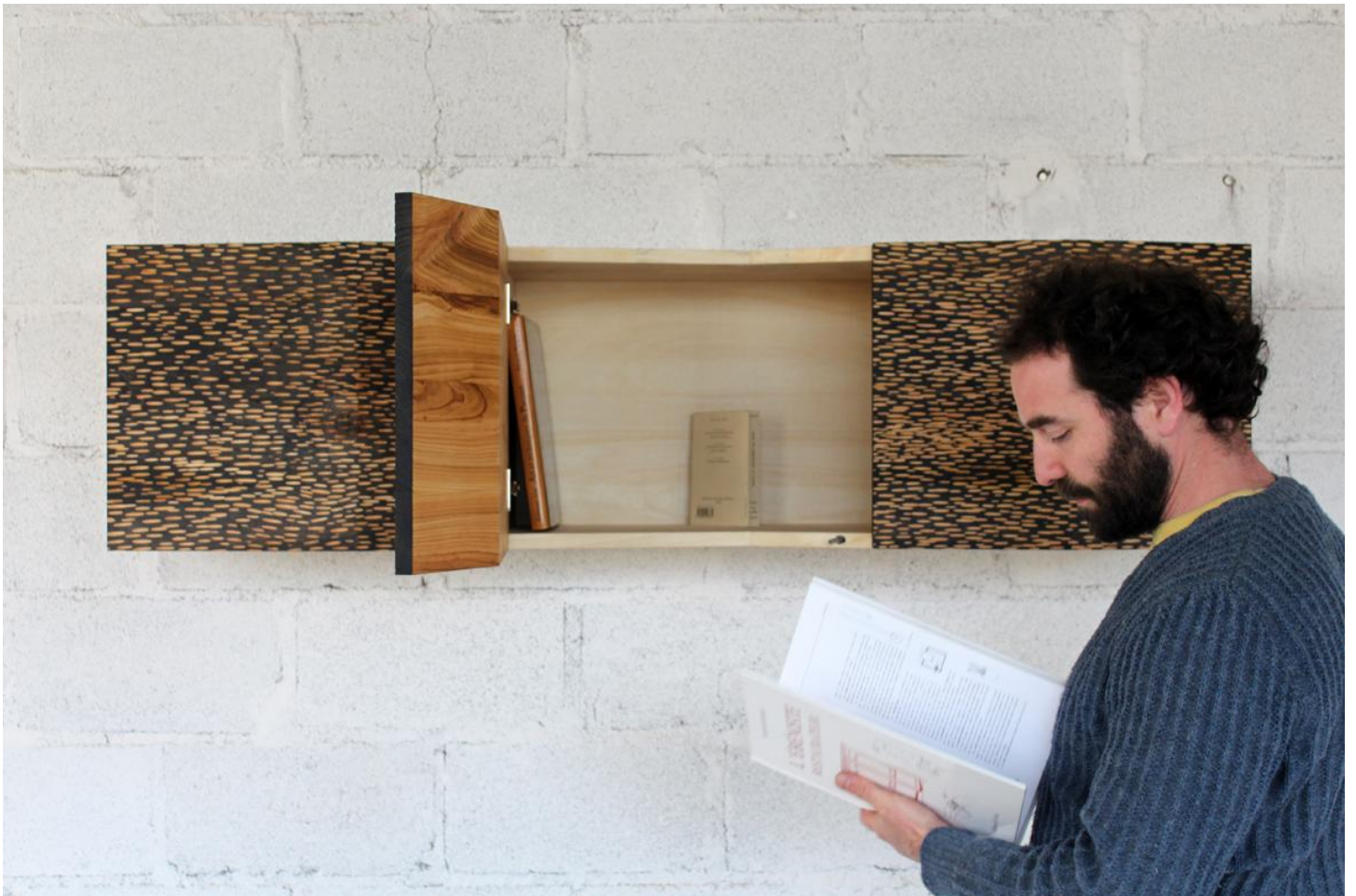
Illustrations : Fabien Chovet – Vorevbois + Yavn Caillaud ; Antoine Mazurier + Sarah Ducarre.